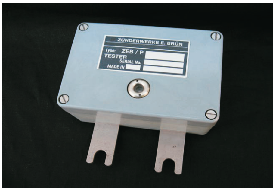
Zündmaschinen-Prüfgerät Typ ZEB/P/HU für ZEB/CU 200 / HU 20 und ZEB/CU 400 / HU 160