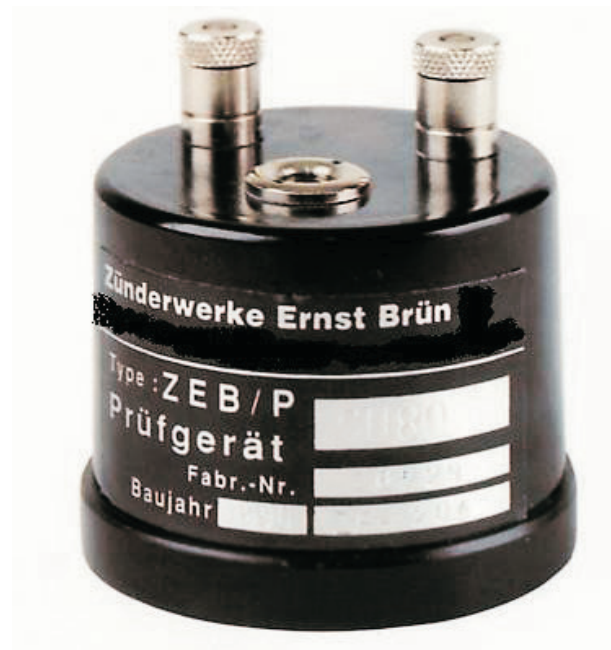
Zündmaschinen Prüfgerät Standard Typ ZEB/P